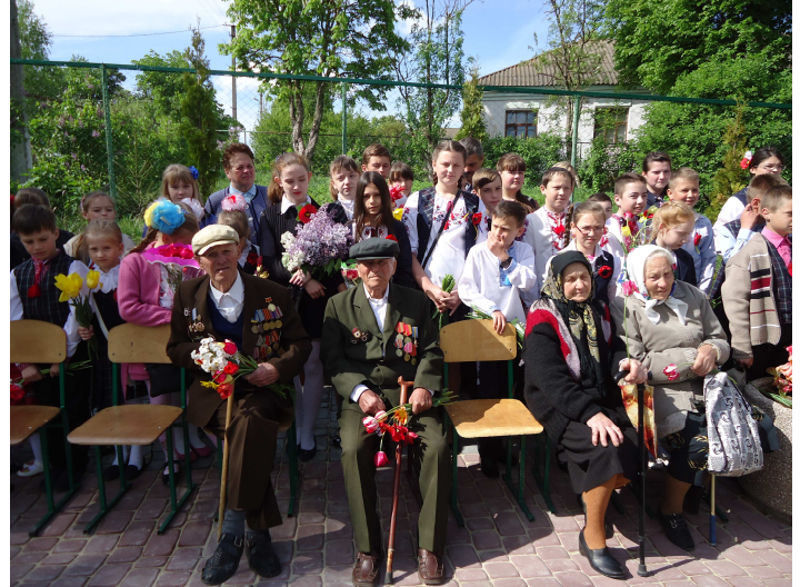
Свято 9 травня – День Перемоги!

Цього року Шаргородщина урочисто відзначила 72-у річницю визволення від нацистських окупантів.